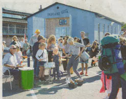
Færgen fik en rytmisk velkomst til Ærøskøbing.

- Der er ikke så mange her endnu, men de kommer om aftenen. Når først musikken begynder, så kommer folk, spår han, selv om han er klar over, at han får Ærø-konkurrence fra det danske kvinde-