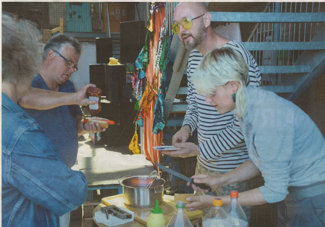
Hot dogs var gratis og i tråd med temaet efter samba-workshoppen.